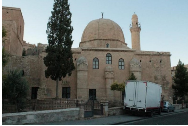
Melik Mahmud camisi güneyden görünüş