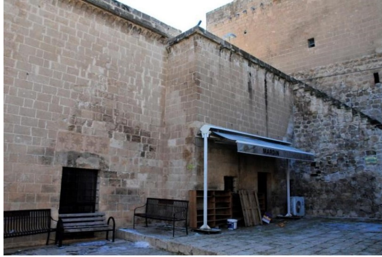
Melik Mahmud cami türbesi giriş cephesi

İç mekân güney duvarında yarım daire formunda mihrap nişi ile iki adet pencere görülmektedir. Mihrap sivri kemerli olup kavsarası sadedir. Nişin her iki köşesinde birer burmalı sütünce vardır. Sütuncelerin üzerinde ise tahrip olmuş başlıklar görülmektedir. Bitkisel bezemeli sütünce kaideleri ile sütunceler restorasyondan kalmadır. Mihrap nişi dıştan profilli sade bir