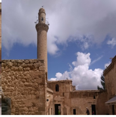
Cami dıştan ana görünümü

Melik Mahmut mezarı şu anda Bayanlar bölümünde olmasına karşın mezarı belirten sandukası olmadığı için dualardan yoksun kalmaktadır.