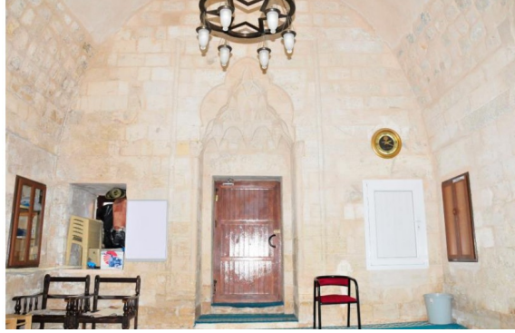
Melik Mahmud cami türbesi kuzey duvarının görünüşü

silme ile ters “U” biçiminde kuşatılmıştır. Batı duvarında iki adet, doğu duvarında ise bir tane niş vardır. Türbe doğusundaki büyük bir sivri kemerle caminin iç mekânıyla bağlantılı hale getirilmiştir