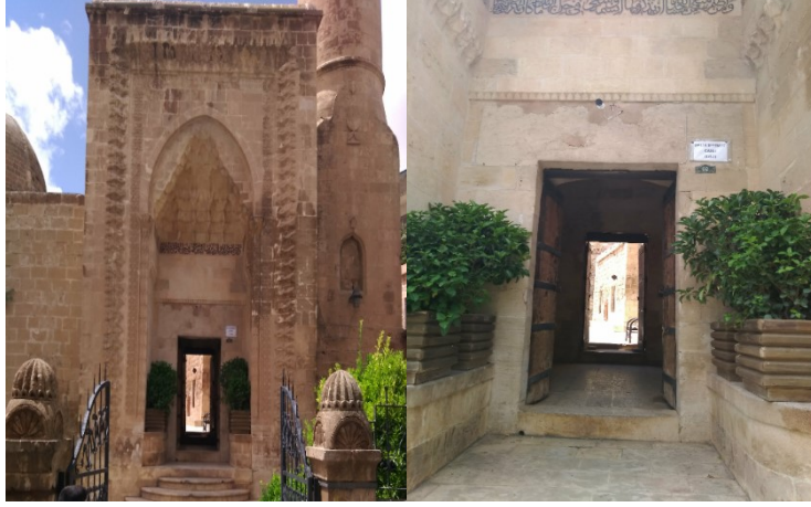
Cami ön cephe

2018 yılının dokuz Mayıs günü öğle namazını bu caminde kıldıktan sonra caminin bu günkü haline ait resimler çektim.