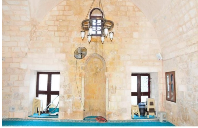
Melik Mahmud cami türbesi kible duvarının görünüşü

Günümüzde caminin bir parçası olması nedeniyle iç mekânda herhangi bir mezar olgusu görülmemektedir.